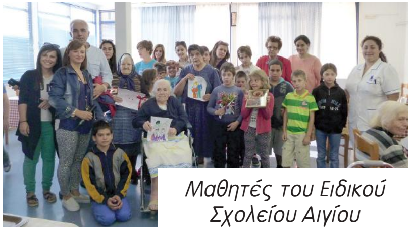
Μαθητές του Ειδικού Σχολείου Αιγίου τιμούν τους ηλικιωμένους