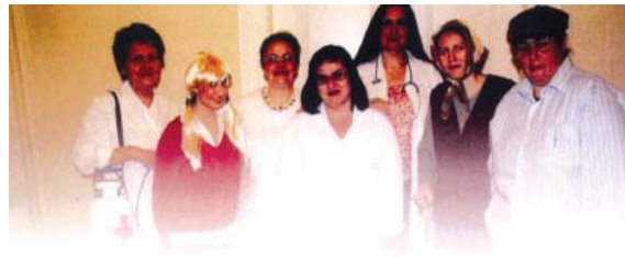
Θεατρική Ομάδα "Ταξιδευτές της Πρόζας"

Πρόκειται για το έργο «Εξωτερικά Ιατρεία» που γράφτηκε από τον Νίκο Γουσέτη και περιλαμβάνεται στο βιβλίο του «Ζακυνθινές ομιλίες». Αξίζει να σημειωθεί ότι «Ομιλίες» ονομάζονται οι υπαίθριες παραστάσεις που γίνονται στην Ζάκυνθο με σκοπό να διασκεδάσουν οι φίλοι. Πρόκειται για μια μορφή τέχνης που αναπτύχθηκε στο νησί παράλληλα με το λόγιο θέατρο και είναι ίσως η πιο αγαπημένη διασκέδαση των ανθρώπων του μόχθου από τα μέσα του 17ου αι. Το έργο ανήκει στο λόγιο θέατρο και το κείμενο, που σατιρίζει την κατάσταση που «τυχόν» υπάρχει στα νοσοκομεία μέσα από διάφορες κωμικοτραγικές καταστάσεις, είναι πραγματικά φανταστικό! Τους ήρωες ερμήνευσαν με πολύ μεγάλη επιτυχία οι