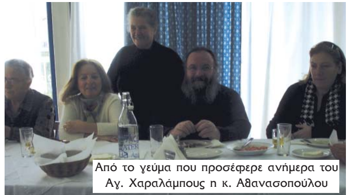
Από το γεύμα που προσέφερε ανήμερα του Αγ. Χαραλάμπους η κ. Αθανασοπούλου