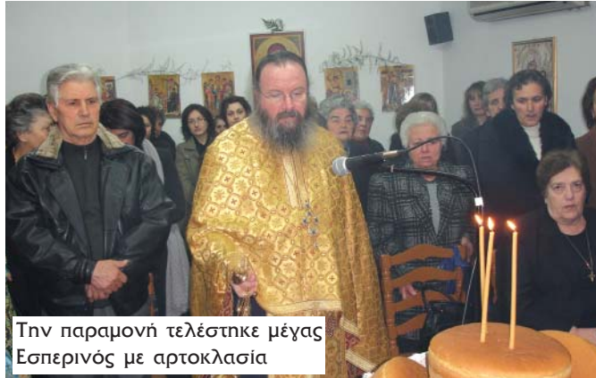
Την παραμονή τελέστηκε μέγας Εσπερινός με αρτοκλασία