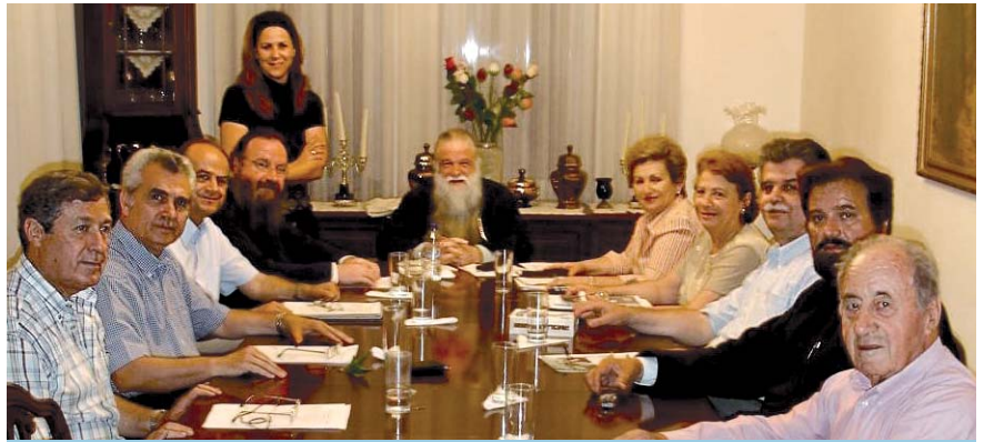
Οι δικοί μας άνθρωποι, τα μέλη του Δ.Σ. του Αγίου Χαράλαμπος, με προεδρεύοντα τον Σεβαστό μας Μητροπολίτη

Μια εκλεκτή ομάδα συμπολιτών μας με ανεκτίμητη προσφορά στο κοινωνικό σύνολο του Αιγίου, είναι αναμφισβήτητα τα μέλη του Διοικητικού Συμβουλίου του Οίκου Ευφηρίας Αγάπης Μελαθρον "ο Άγιος Χαράλαμπος".